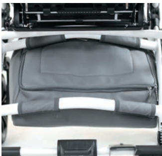
Bolsa bajo asiento