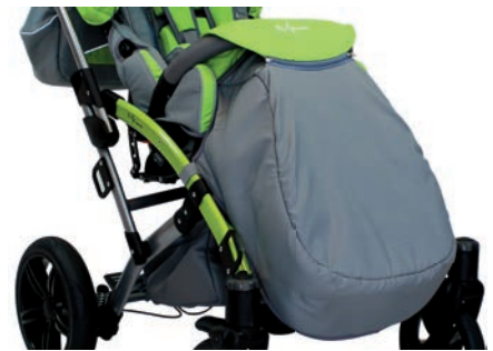
Saco de dormir