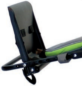
Cincha para los pies