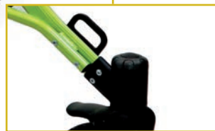
Kit de transporte