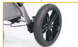
Ruedas delanteras y traseras con amortiguación