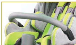
Barrera de seguridad