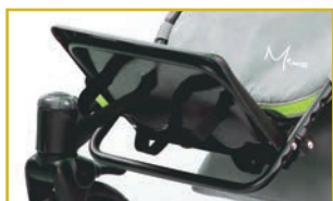
Reposapiés plegable y ajustable en altura