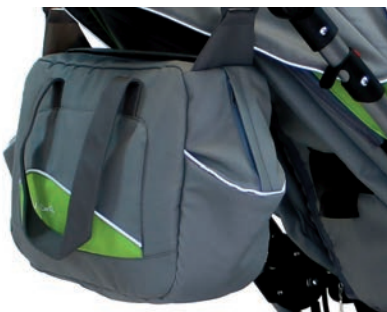
Bolsa para manillar