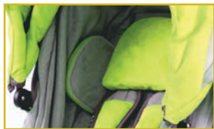
Almohadillas protectoras del tronco y la pelvis