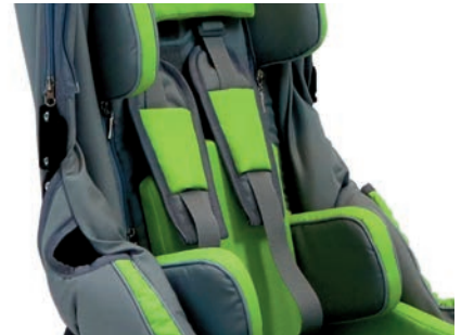
Cinturón de 5 puntos