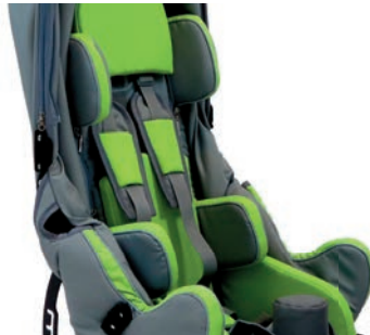
Controles de cabeza, tronco y cadera