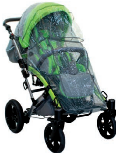
Protector para lluvia