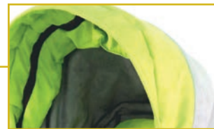
Visera con ventanilla